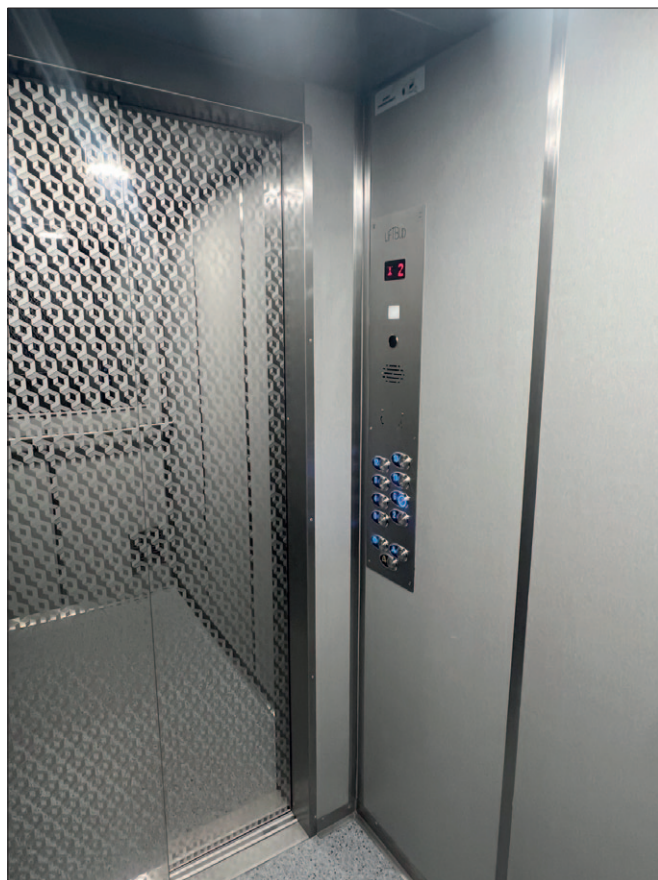
Tysiąclecia 19 - zakończony remont dźwigów