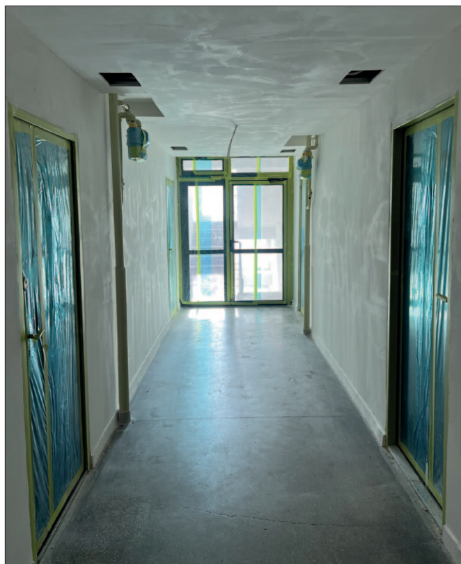
Piastów 5 - trwający remont korytarzy lokatorskich i klatek awaryjnych