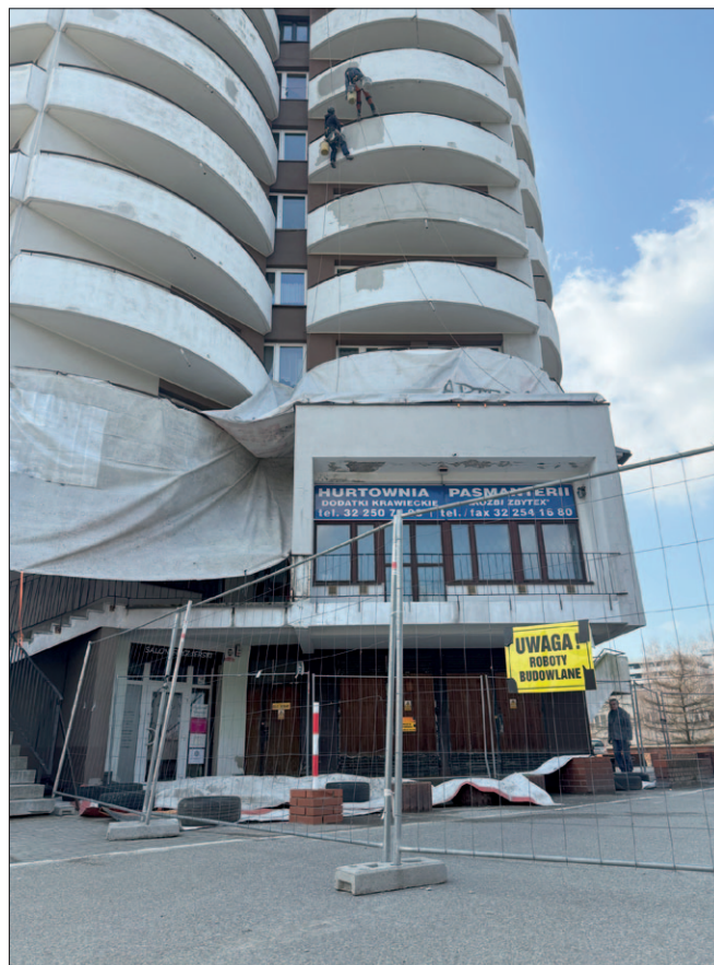
Zawiszy Czarnego 4 – trwające prace alpinistyczne na elewacji budynku